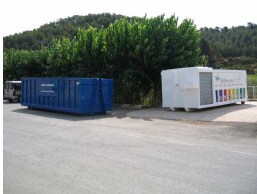
Caixa compartimentada i caixa complementària ubicades en un dels municipis de la comarca.