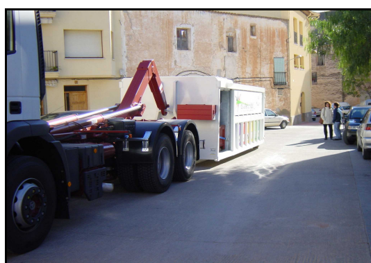
Camió durant les tasques de càrrega i descàrrega de la caixa compartimentada (model 1) de la deixalleria mòbil.