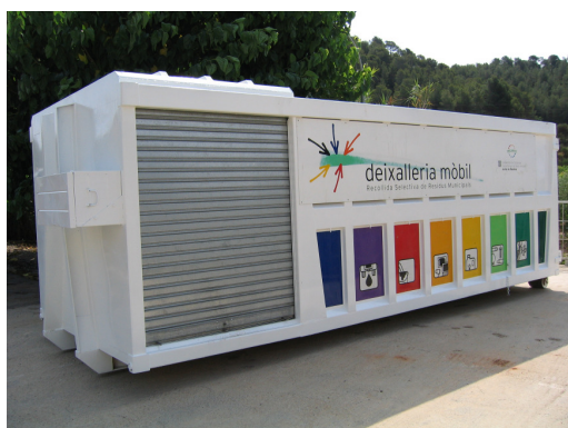
Caixa compartimentada (model 1 de l'ARC) per a la recollida de residus especials.

L'equipament actual del servei compta amb dues caixes compartimentades (model 1 de l'Agència de Residus de Catalunya) per a la deposició dels diferents residus especials, juntament amb dues caixes complementàries (contenidors oberts de 25m 3 de capacitat) exclusivament per alguns residus voluminosos. Les caixes es transporten mitjançant un camió dotat amb braç hidràulic articulat i amb maniobra d'ampliroll .