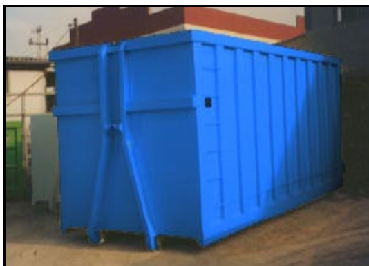
Caixa complementària per a la recollida dels residus voluminosos.